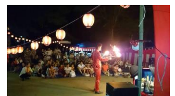
↑夏の夜はやっぱり祭りじゃー！